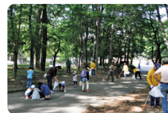
まちがきれいだと気持ちいい！環境美化活動