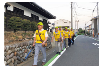
地域の安全のために！交通安全・防犯活動

このほかにも、自治会は、地域内の各種団体と協力して、さまざまな活動をしています。