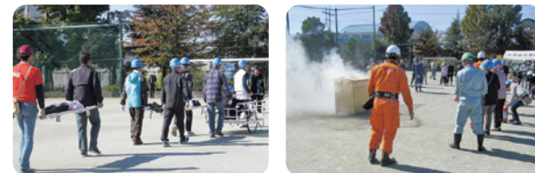
日頃の備えが大切！防災活動