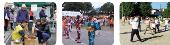
楽しさいっぱい！お祭りやレクリエーション活動

交通事故を防止するための活動や犯罪からまちを守るための防犯パトロール、地震等による災害に備える防災活動、ごみ収集所の管理や道路・公園などの清掃、花の植栽などの環境美化活動、地域の交流や親睦を深めるレクリエーション活動などを実施しています。私たちの生活は、自治会の活動によって支えられていることがたくさんあります。